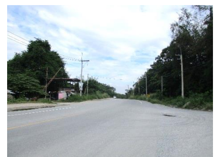
ทางหลวงหมายเลข 3144