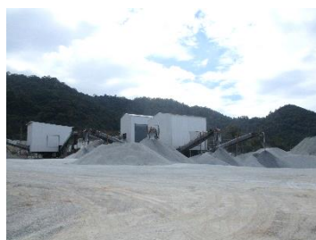
พื้นที่โรงโม่หินของโครงการ