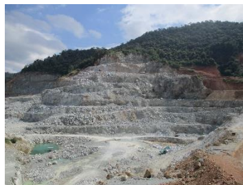
พื้นที่หน้าเหมืองปัจจุบัน

พื้นที่โครงการ ประทานบัตรที่ 21378/15248