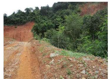
แนวเวนไม่ทำเหมือง