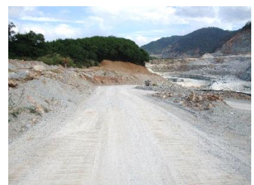
เส้นทางขนส่งแร่ระหว่างหน้าเหมือง-โรงโม่หิน